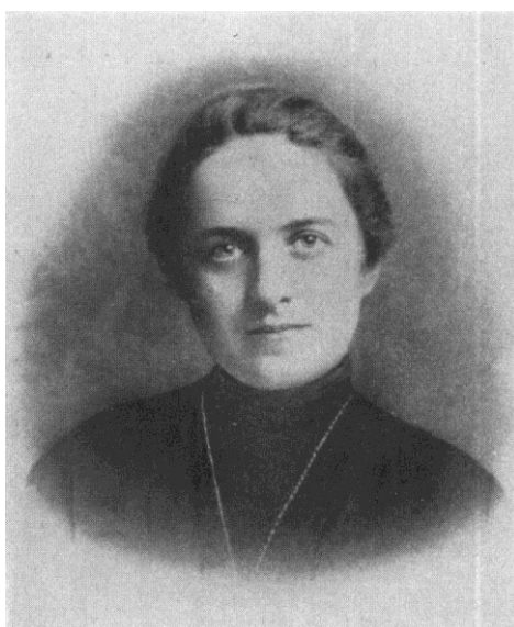
(Kb. 1908-ban készült felvétel)

nem avatkozott bele. Kivételt csak egyszer tett és akkor is csak azért, mert mint székesfehérvári püspök és Magyarország legnagyobb szónoka, pártfogásába akarta venni a Szociális Missziótársulatot fennállása egyik legkritikusabb pillanatában; atyai jószággal melléje állt és az Alapító Főnöknőnek az akadályok sikeres legyőzésében nagy segítségére volt. Farkas Edith sohasem felejtette el ezt a szeretetteljes szolgálatot. A bensőséges, Szalézi Szent Ferenc és Chantal bárónő levelezésének magas nivójához közeljáró kapcsolatot élete végéig ápolta és örökké hálás volt neki. A Szociális Missziótársulat pedig sohasem felejtje el, mily sokat köszön Prohászka Ottokárnak.