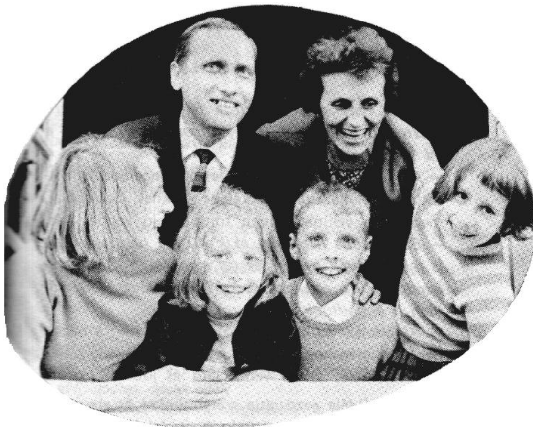
A szerető család TÜKÖR, amely Isten szeretetét mutatja.