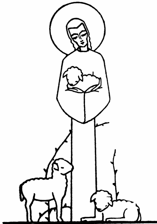
Az első kiadás címlapja