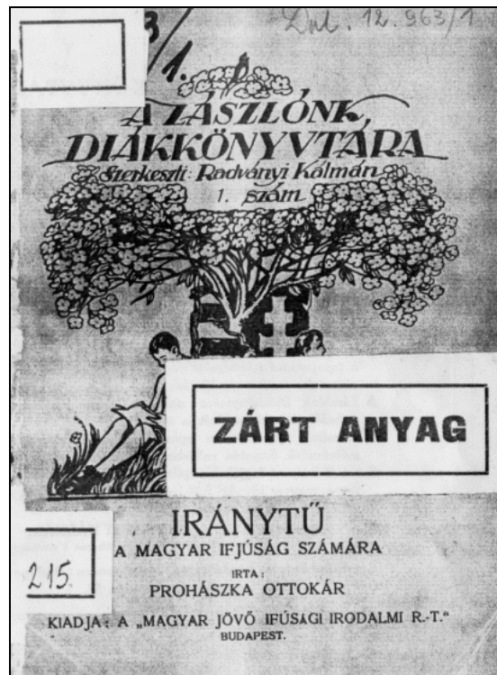
Az eredeti kiadvány borítója az OSZK állományában

Önkéntelenül adódik a felismerés: mennyire az ország mai, 21. századi helyzetére is vonatkozik Prohászka minden megállapítása! Jelen sivárságunk orvoslásához is elengedhetetlen egy fiatal apostoli gárda felnevelése és útnak indítása. Megrendítően hatnak a magyar diákokhoz intézett felhívások. Mindegyik írás valóban IRÁNYTŰ kíván lenni számukra. Eszmények nélkül nem élhet az ember, – különösen nem a fiatal!