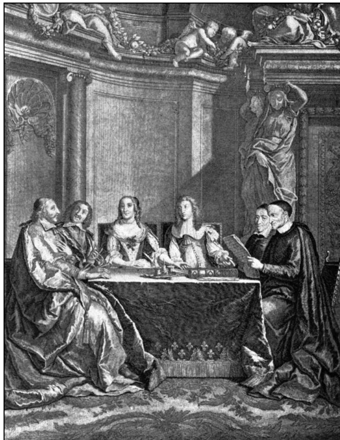
A királyi tanácsban

A Lelkiismereti-tanács intézte az összes egyházi ügyeket.