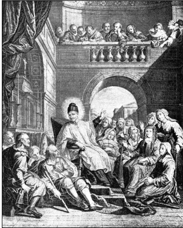
A szegények között

Skócia partjain 1651-ben kötöttek ki Le Blanc és Duiguin. Holland kereskedőknek öltöztek, de így is hamar nyomára jöttek otlétüknek.