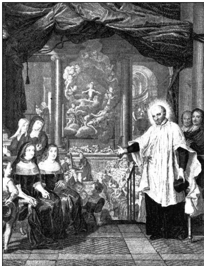
A Szeretetegyesület gyűlésén

ütközetet, az ítélet egyszerű volt: a parancsnok karddal a kezében végigjárta a rabokat: egyiknek fülét, másoknak orrát, karját, vagy ha úgy tetszett neki, a fejét vágta le.