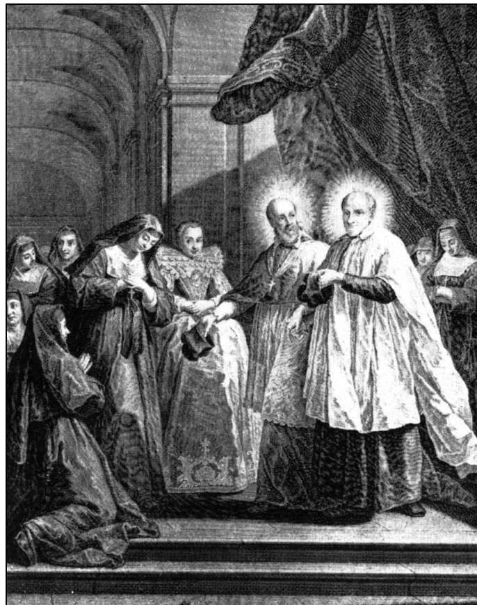
A vizitációs nővéreknél

Az első könnyen ment. De Gondi János Ferenc 1646. november 20-án kelt leiratában jóváhagyta az alapszabályokat. Eszerint az Irgalmasnővérek Társulata a párizsi érsek fennhatósága alatt áll. Haláláig „kedves és nagyon szeretett de Paul Vincénk” kormányozza. Utána pedig a mindenkori párizsi érsek nevez ki belátása szerint általános főnököt.