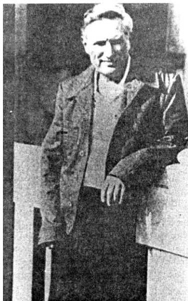
A harmadik, egyben utolsó szabadulást követő napokban, 1977 júniusában, tizenegy év és két hónap börtön után.

Vajon mindez a véletlen műve lett volna? – teszi fel a kérdést a műsor vezetője, és neves gyógyszerész professzort szólít meg a stúdióban.