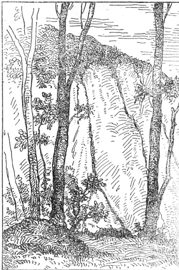
A hármas barlang betemetett bejárata

Ősz volt, amikor itt jártam először. Teljes pompájában lángolt az őszi erdő. Talán sehol sem olyan pazar, olyan csodás az ősz, mint itt. Hihetetlenül szép! Egész hegyhajlatokat égő-vörös lombosítók takart. De olyan változatos színfoltokban s keveredve a sárga és a zöld finomabbnál-finomabb árnyalataival, hogy egy Rónay Kázmér ecsetje is megirigyelhette volna.