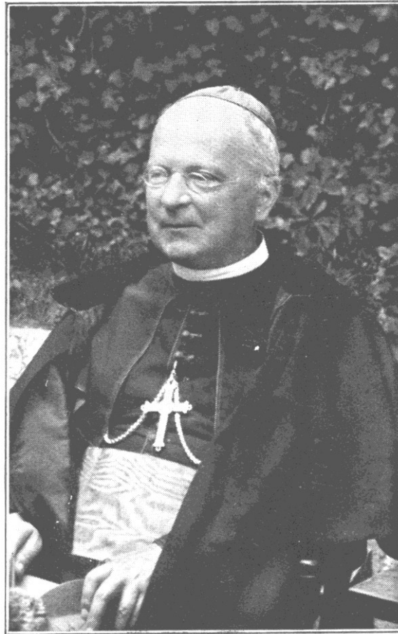
Majláth Gusztáv Károly érsek 1864–1940.

Majláth püspök életében szinte törvényszerű következetességgel domborodnak ki a lelkiélet vonásai, úgy amint azokat a nagy szentek történetéből ismerjük. Az évszámok és egyéb események csak külső foglalatát adják ennek a benső életnek, sőt ha egymagukban tekintenek a keretet: üres és torz képet adnának a valóságról. Emberileg szólva ebben rejlik minden lelkiességnek a tragikuma; magasabb szempontból tekintve azonban ismét az igazi lelkiélet törvényszerű megnyilatkozására ismerünk. A komoly történetkutatás, melyet a magyar szellemi térben leghitelesebben Szekfű Gyula képvisel, lesz hivatva e törvényszerűség metrikája szerint Ardeal (Erdély) püspökének igazi benső világát a jövő számára rekonstruálni.