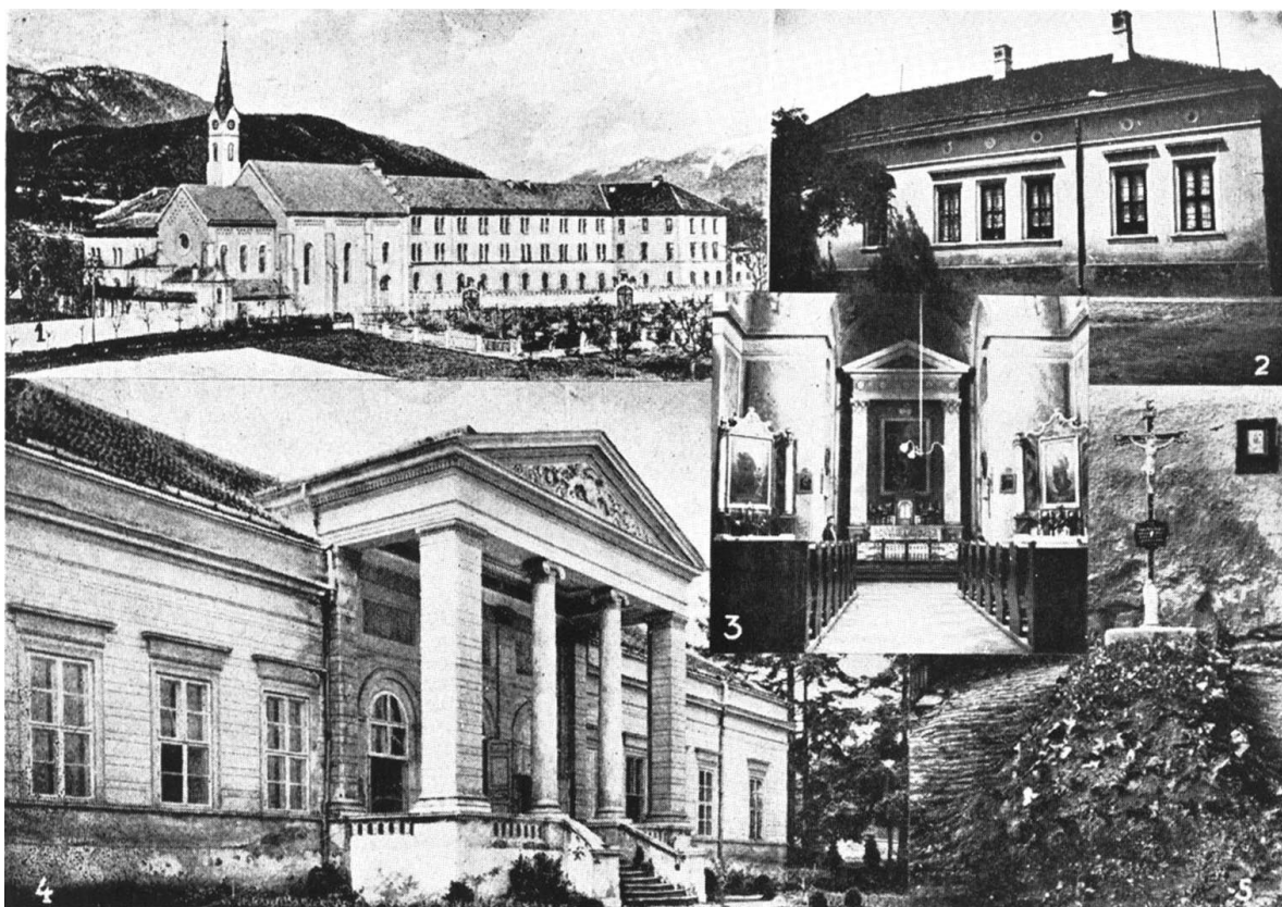
1. Thurnfeld. 2. Születési háza Melencén. 3. A piaristák háza Nagybecskereken. 4. Érd. 5. Sír a Duna felett.