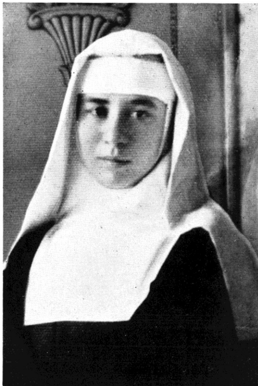
Semper fidelis! ... A hűséges újoncnő