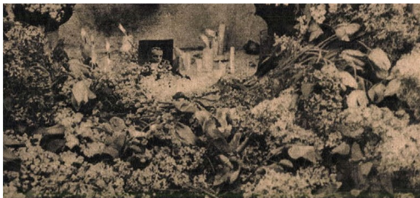
Virágok, virág, virág tornyosul a szobor talapzatán