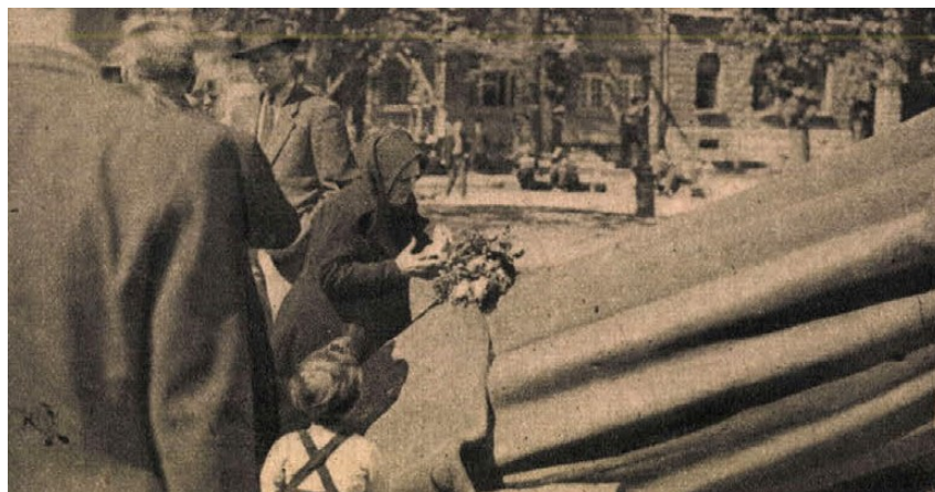
Egyszerű öregasszony gyöngyvirágcsokra a ledöntött érckolosszus talárján.