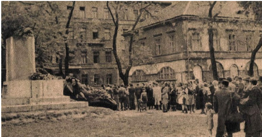
Kora reggeltől kezdve nagyszámú katolikus hívő látogatta meg a ledöntött szobrot és halmozta el virággal