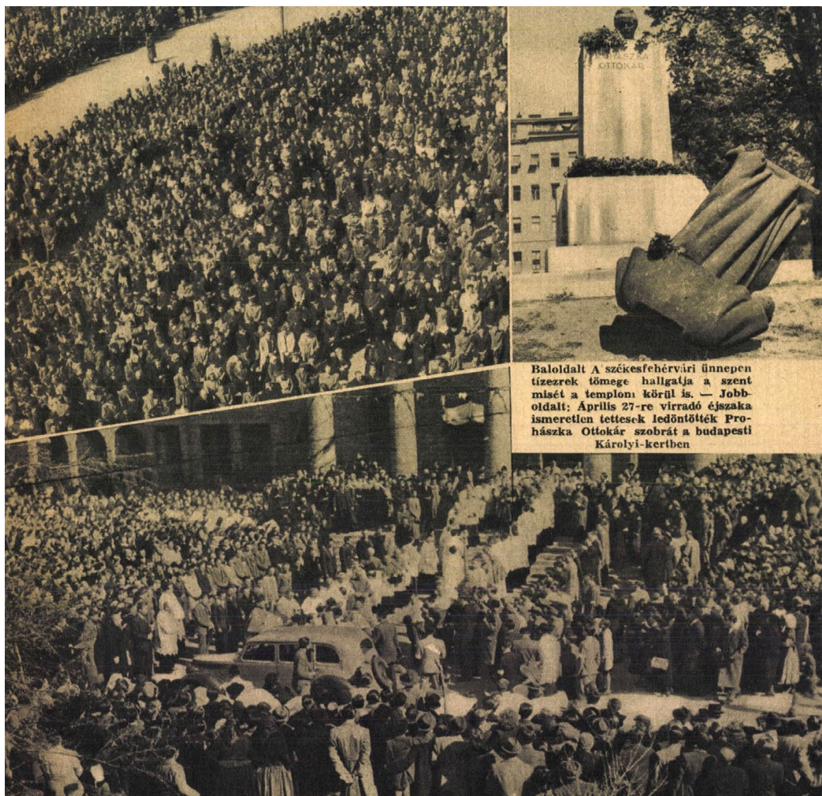
Baloldalt A székesfehérvári ünnepen tízezrek tömege hallgatja a szentmisét a templom körül is. — Jobboldalt: Április 27-re virradó éjszaka ismeretlen tettesek ledöntötték Prohászka Ottokár szobrát a budapesti Károlyi-kertben

Baloldalt: A székesfehérvári ünnepen tízezrek tömege hallgatja a szentmisét a templom körül is.