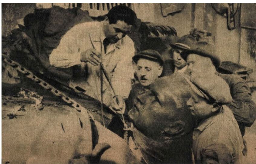
Javítják a szobrot a bronz öntőműhelyben