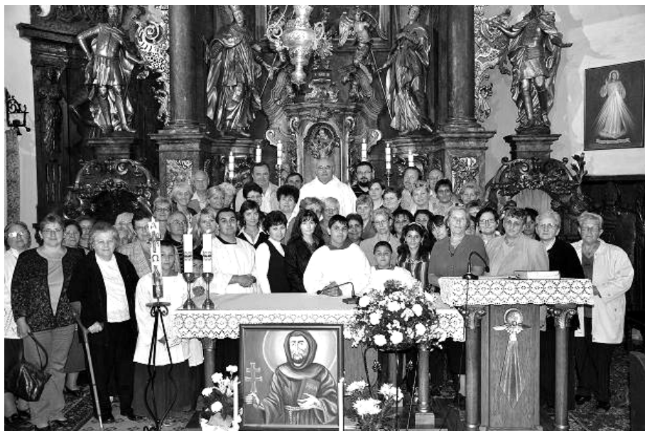
A borsi közösség tagjai.

alól – egészségügyi okokból. A testvéri közösség ugyan kéthetente találkozott, imádkoztunk, ferences énekeket énekeltünk, a képzési anyagot felolvasta a képzésfelelős, de a lelki asszisztens vezetése hiányt jelentett számunkra.