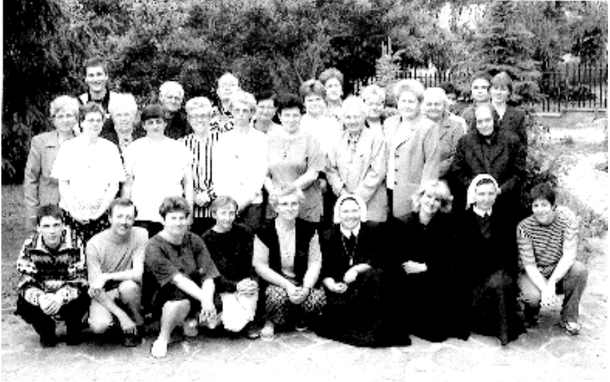
A Nagykaposi világrendiek és a környékbeli testvéri közösségek tagjai.

Húzzuk a fülünket, elnémul a lelkünk, kibúvót keresni arra már nincs merszünk. Köszönet jár mostan a lelkiatyáknak, kik elláttak bennünket útjelző táblákkal.