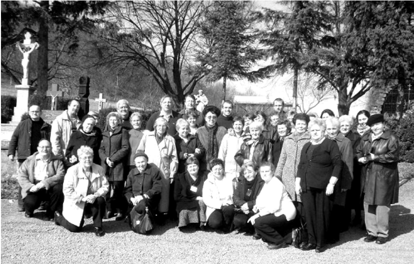
Az imregi 2012-es káptalan résztvevői.