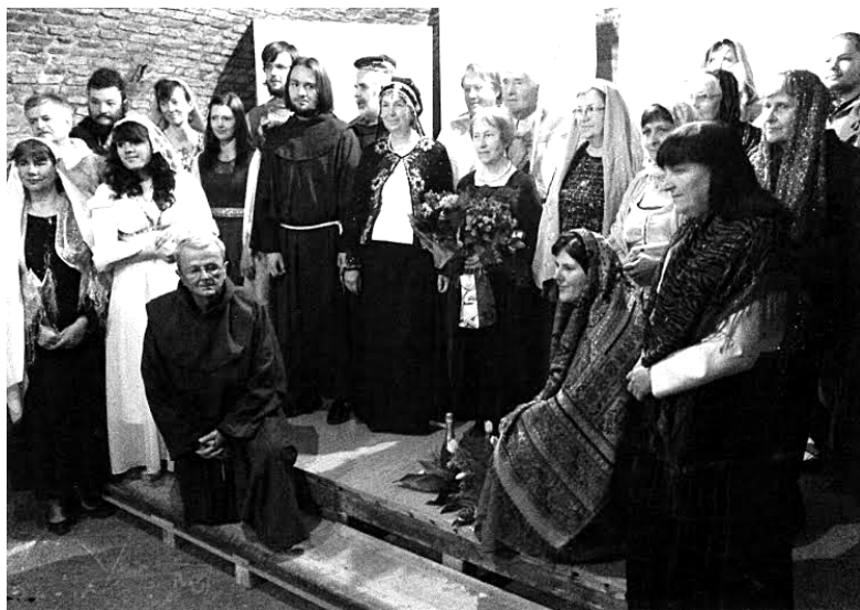
Az Assisi zsoldos c. színdarab szereplői.