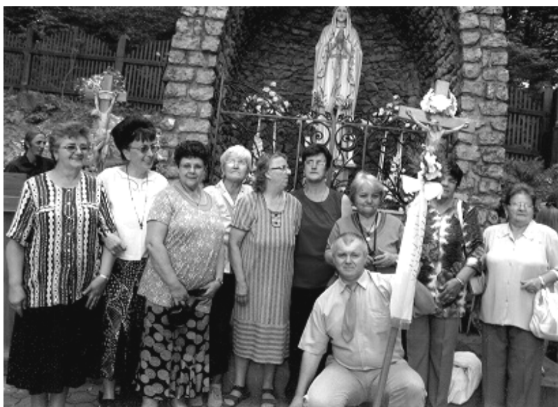
Egy kis csoport Losonc-Füleki világrendi testvér a Várhosszúrétai búcsún.

Ami engem különösen megfog testvéreim magatartásán az nem más, mint a szentmise áldozatához való ragaszkodásuk. Ennek a ragaszkodásnak köszönhető az is, hogy szálnalmas botladozásainkból Isten kegyelmével rövid időn belül talpra tudunk állni. Kis közösségünkben olykor-olykor az összefüggések alkalmával tehetetlen ide-oda hánykódásaink kisebb-nagyobb vitába torkollanak, viszont a kiengesztelődés áldozatában mindenki csendre hangolódva magába száll és rácsodálkozik Krisztus szeretetére. És ez csak békét szülhet, és ezáltal dicsőséget arat.