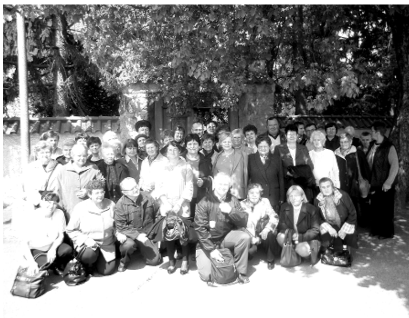
Ipolybalogon megtartott 2015-ös FVR káptalan résztvevői.