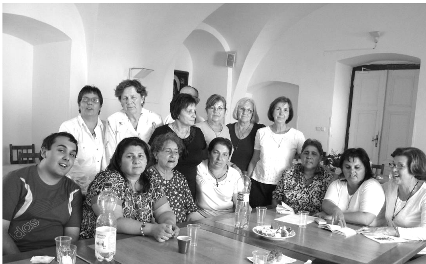
A 2011-es kassai káptalan alkalmából készült felvétel a résztvevőkről.