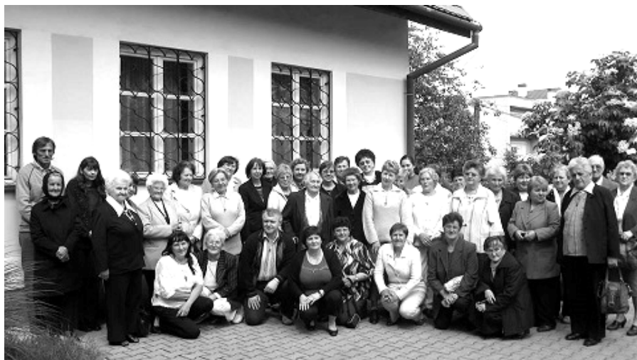
A losonci FVR 2013-as káptalan résztvevői.

Krisztus, irgalmas Jézus, nézz le ránk szeretettel. Az ő irántunk való szeretetére a mi szeretetünkkel válaszoljunk és újítsuk meg az Isten végtelen irgalmasságában való hitünket és bizalmunkat.