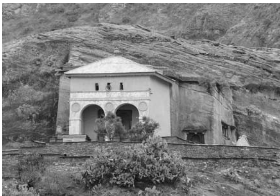
Kőbe vájt templom Etiópiában (Ábraha Adzsbeha)

Máté az Úrnak ajánlotta a király lányát, Iphigeneiát. Ő pedig kétszáz szűz lánnyal együtt úgy döntött, sosem megy férjhez. A Legenda Aurea úgy folytatja, hogy Máté apostolnak ezután szerte Etiópiában híre ment. A király fiának, Eufranurnak meggyógyításával olyat vitt végbe, amire a mágusok képtelenek bizonyultak.