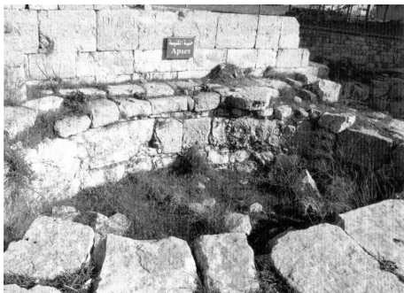
A bazilika apszisa Mamrëban

A nyugati egyház nem sorolja Konstantint szentjei közé, ő tud árnyoldalairól is. De mégsem felejtette el, hogy mit köszönhet neki. Hogy a „ konstantini fordulat ”, már hamarosan a császár után vitatható kapcsolatot teremtett a vallás és a politika között, nem az ő terhére írható. Ő még nem tette a kereszténységet római államvallássá. Ő a keresztényeknek és az egyháznak csak a szabadságot adta meg és ezt nem más vallások és kultuszok kárára tette. Az ő Milánói rendelete vallásszabadságot adott a római birodalom minden polgárának. Ez még most is időszerű lenne sok olyan országban, amelyek egykor Konstantin uralkodási területéhez tartoztak. Ha a „szent” melléknevet nem is, de a „Nagyot” igazán megérdemli .