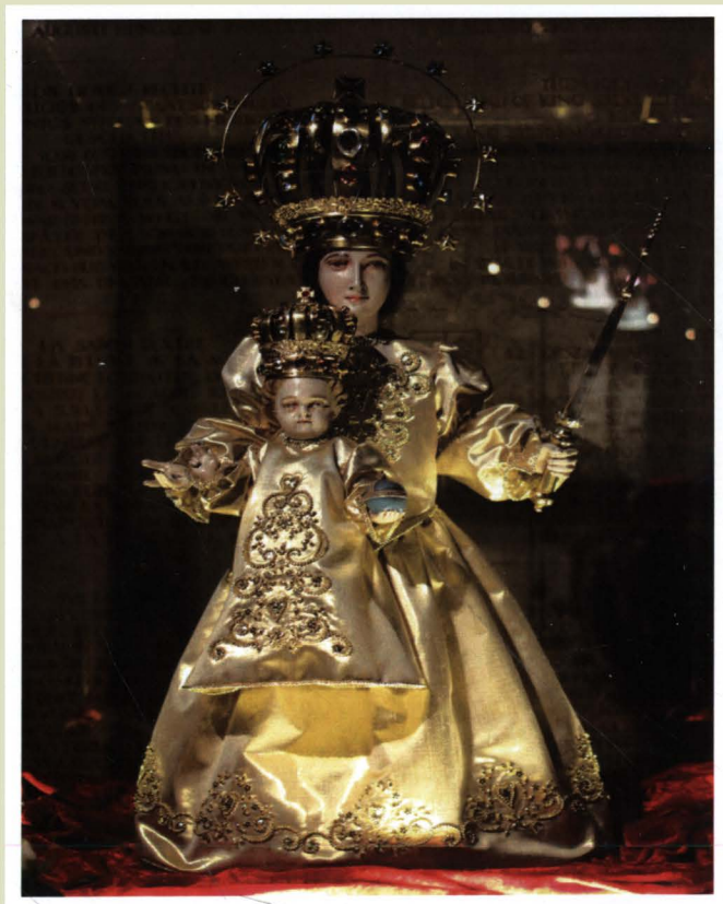
A Mátaverebélyi Szűzanya-szobra a budapesti Bazilikában

Egy példány ára 250 Ft az évi négy szám 1000 Ft (+ postaköltség)