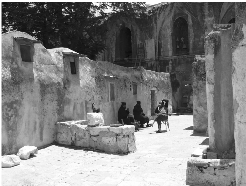
Abesszin szerzetesek cellái a Szent Sír Bazilika fölött

megnyílik az önmagát kinyilatkoztató és az embert megváltó Istennek; megnyílik Jézus Krisztusnak, akiben testi formában lakik az istenség teljessége s ezért egyedüli és egyetemes Megváltója minden embernek. A kényelmes istenkép meghagy bennünket magunknak, bezár saját elgondolásaink és törekvéseink börtönébe, semmire sem kötelezve bennünket. Jézus Krisztus a hit által kiszabadít önmagunk, torz elképzeléseink és vágyaink fogságából, az élő Istennel ajándékoz meg bennünket, odaajándékoz minket Istennek és ajándékká tesz bennünket egymás számára. Ehhez azonban a hitben mindent rendelkezésre kell bocsátanunk, egész önmagunkat, mindenestül.