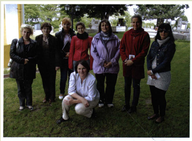
A Biblikus Figurák kurzus résztvevői Sajópálfalán

Egy példány ára 250 Ft az évi négy szám 1000 Ft (+ postaköltség)