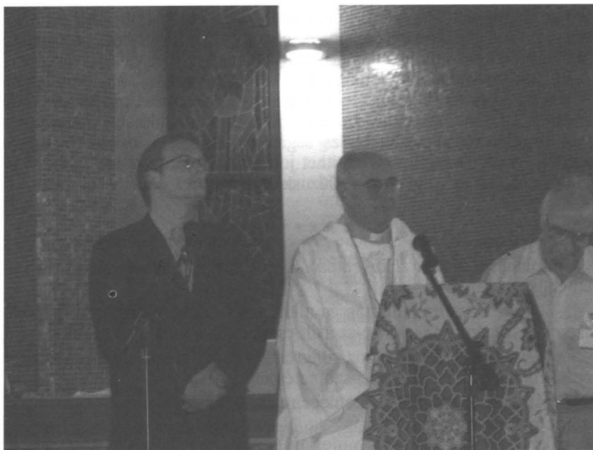
Világkongresszus: A Katolikus Bibliaszövetség elnöke (középen) és főtítkára (balról)

A Dei Verbum folyóirat rövid beszámolót közöl a bibliaapostolság helyzetéről és tervciről a világ számos ( nagyrészt általunk alig ismert) területén. Több helyen hiányzik a bennszülöttek nyelvein olvasható bibliafordítás; másutt a nyomor, a háború, vagy az elnyomás körülményei között csodálhatjuk az Egyház hősies működését és ennek eredményeit. Rövid bemutatást olvashatunk 11 régió új koordinátorairól és a Világszövetség új (9 tagból álló) vezető-testületéről. Ennek a pápa által 6 évre kinevezett elnöke Vincenzo Paglia , Terni-Narni-Amelia püspöke. A vezető testület 2002. decemberében Alexander M.Schweitzer teológia- és misszió-tudóst választotta főtítkárrá, aki már 6 éve a Világszövetség szolgálatában dolgozik. (Forrás: Dei Verbum 3-4/2002.)