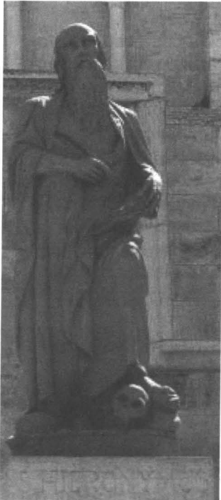
St. Jeromos, Betlehem, Szent Katalin kolostor