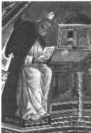
Giotto: Az egyházdoktor

(Stridon, 347 körül – Betlehem, 419/420. szeptember 30.)